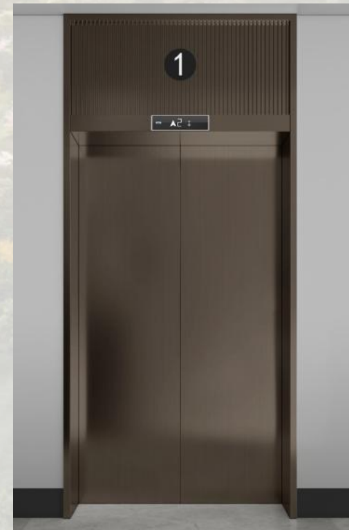
A栋患者厅电梯-厅门装潢