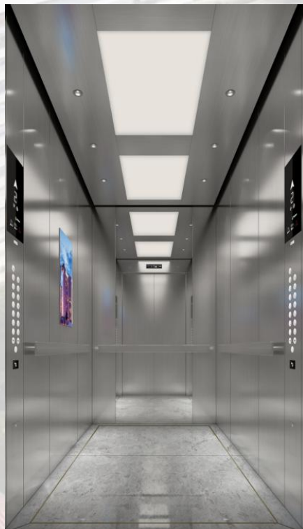
A栋医用电梯-轿厢装修