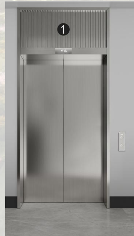
A栋医用电梯-厅门装修