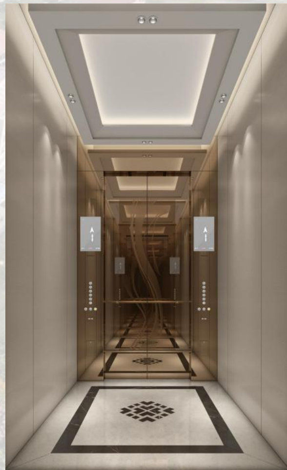
B栋办公楼-轿厢装潢