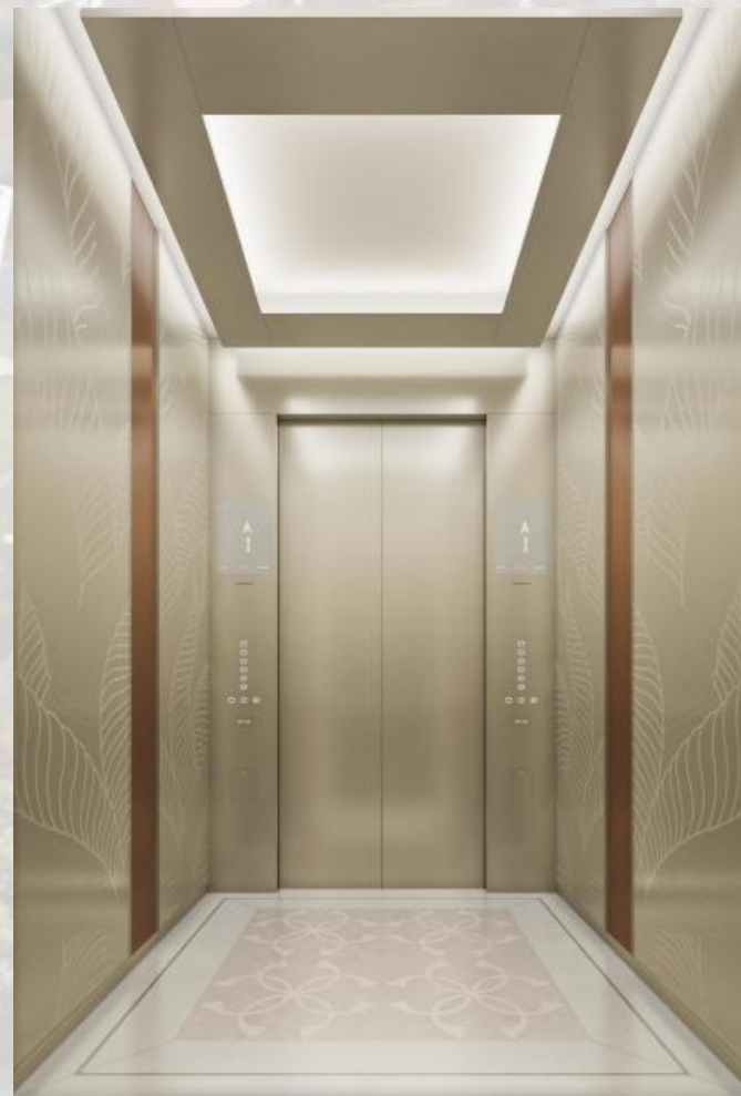
B栋餐厅电梯-轿厢装潢