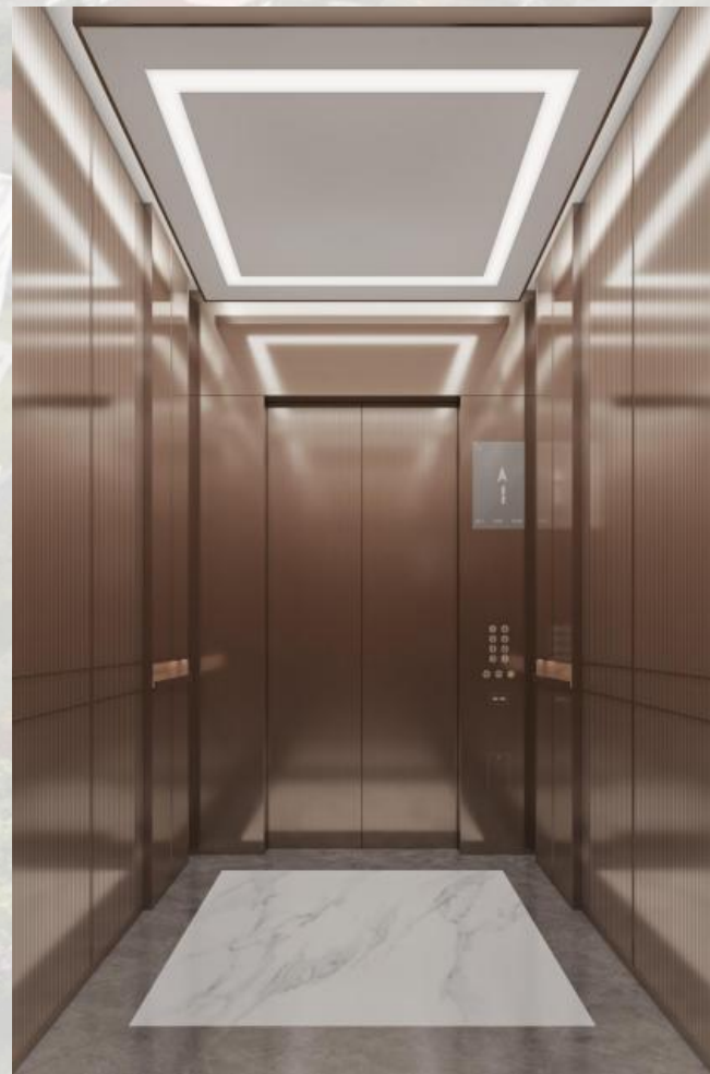
B栋宿舍电梯-轿厢装潢