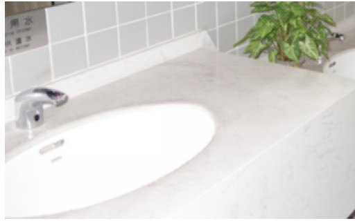
图 1 台面和台盆