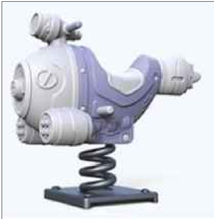
儿童摇摇马意向图