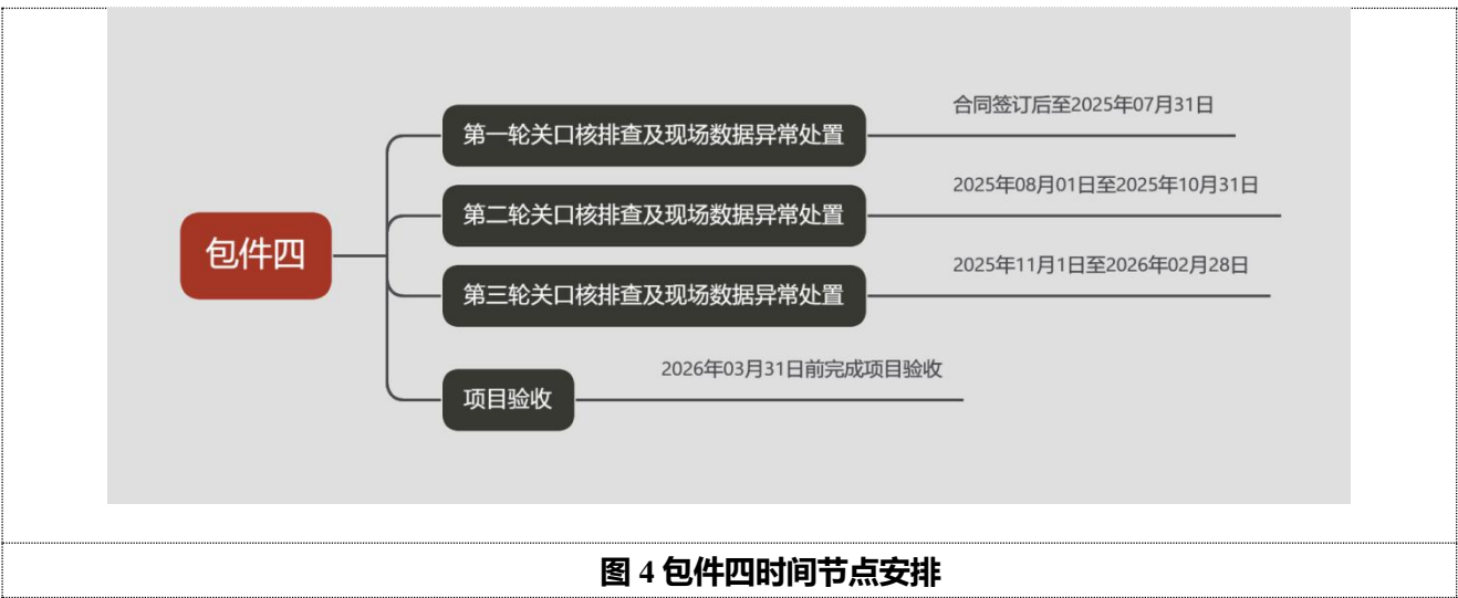
图 4 包件四时间节点安排

本包件的工作对象为本市每年发布的重点用能单位名单中，注册地位于嘉定、静安、奉贤等区域的企业，减去对应区域已开展全面核排查的企业，约计 230 家左右重点用能企业。本项目针对筛选出的 230 家左右的用能单位，自二季度起，针对每家用能单位，按照时间节点分别开展第一轮、第二轮及第三轮关口核排查及现场数据异常处置，时间节点见 错误!未找到引用源。 4。