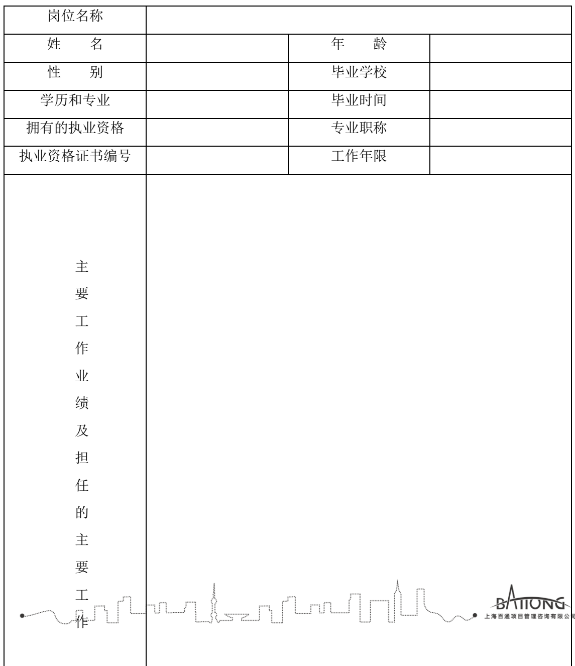
附 2：主要项目管理人员简历表

注：主要项目管理人员指拟任项目副经理、技术负责人、合同商务负责人、专职质量管理人员、专职安全生产管理人员及其他关键岗位人员等。应附执业资格或岗位证书，专职安全生产管理人员应附安全生产考核合格证书复印件。