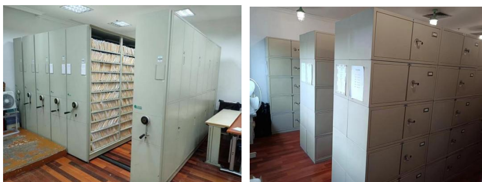
密集柜与集中存档区

投标人在协助打包过程中要根据招标人要求做好文件档案的登记造册，明确登记每个包装单元档案的编号信息并密封包装。搬运过程中注意安全，做好避雨防潮工作。送达浦东校区后，根据招标人要求及编号信息，将搬迁档案文件解封后上架到相应的档案库房或办公场所。