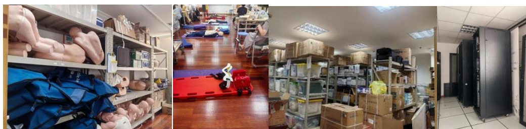
实训教具及监考系统