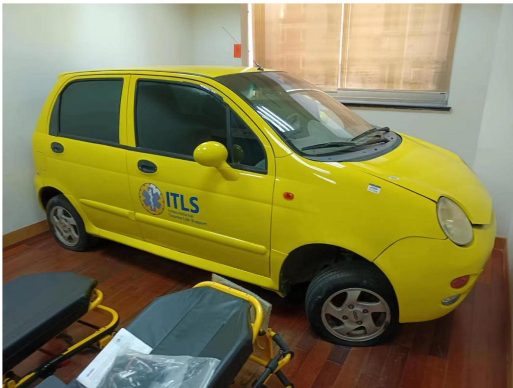
无动力教具车的拆解出门、散件运输、入户后组装