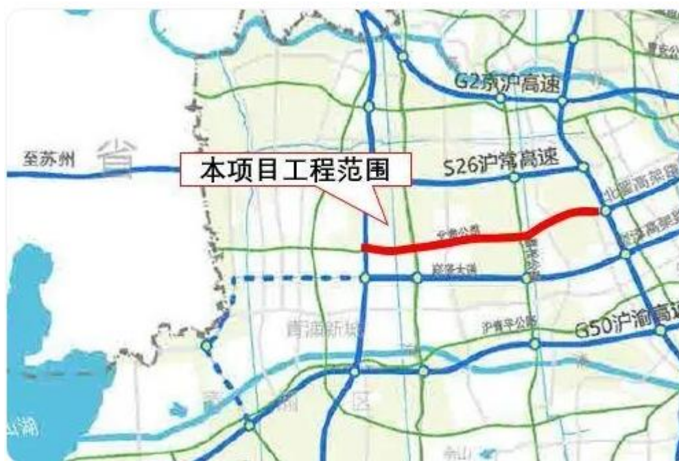
(北青公路(外青松公路—华徐公路)改扩建工程区位图)