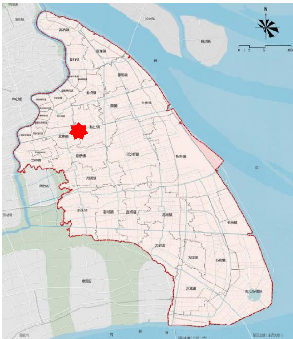
图 1 张江镇在浦东新区的区位图

张江镇位于上海市浦东新区中部、张江科学城北，东毗川沙新镇、唐镇，西邻花木街道、北蔡镇，南与康桥镇接壤，北与金桥镇相连，总面积约为 45.02km 2 。