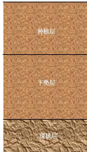
图 1 造林项目客土回填示意图